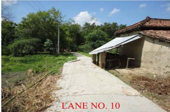
LANE NO. 10