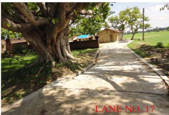
LANE NO. 17