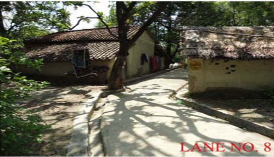
LANE NO. 8