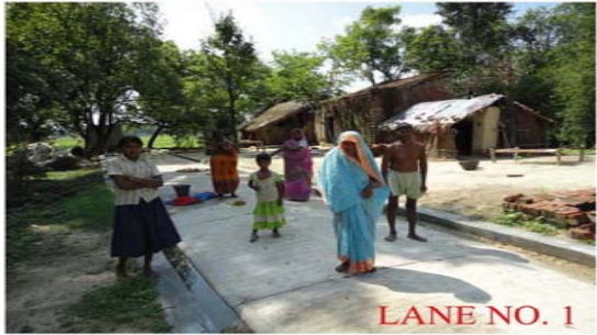
LANE NO. 1