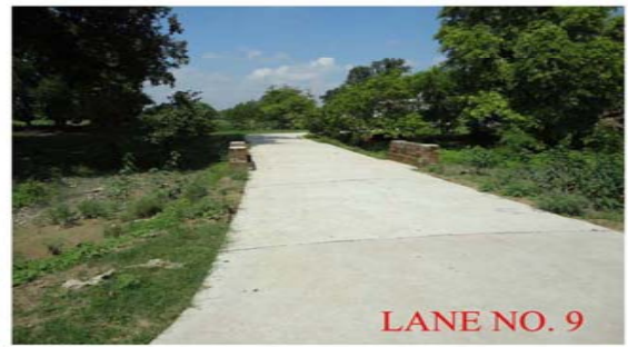
LANE NO. 9