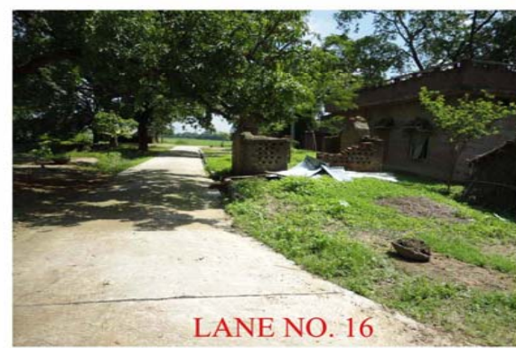
LANE NO. 16