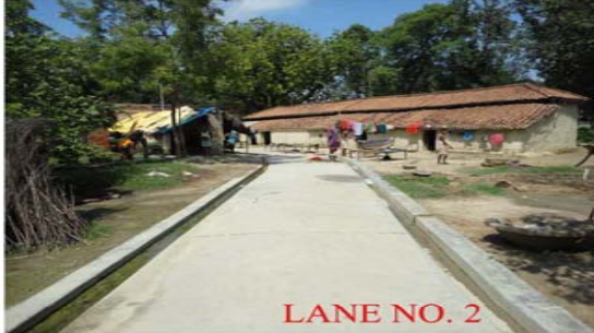
LANE NO. 2