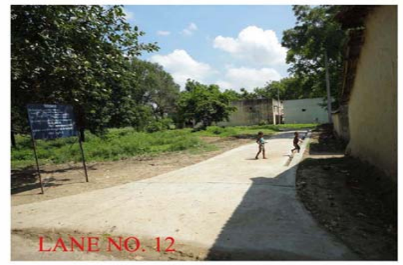
LANE NO. 12