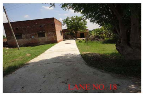
LANE NO. 18