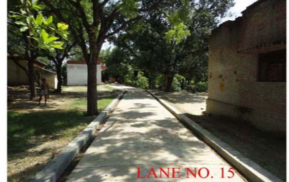
LANE NO. 15