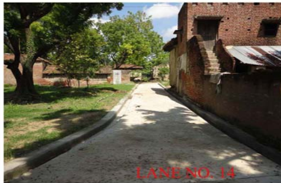
LANE NO. 14