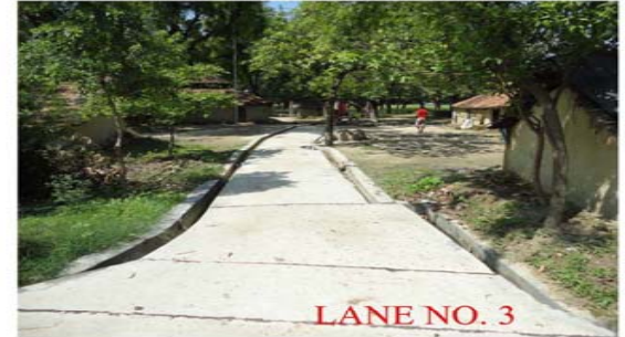
LANE NO. 3