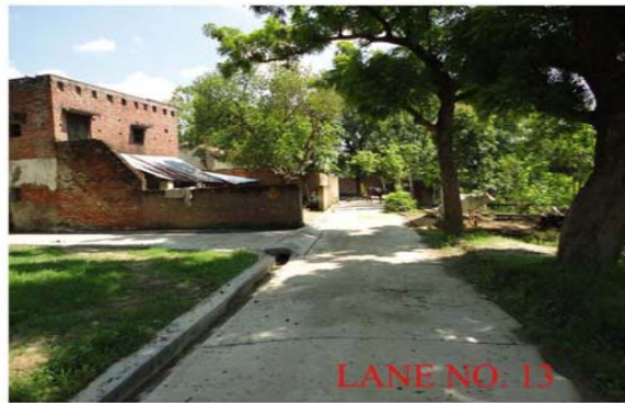
LANE NO. 13