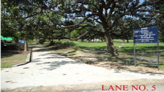
LANE NO. 5