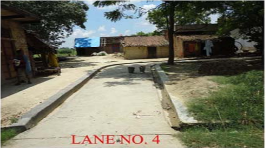
LANE NO. 4