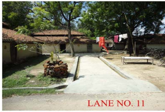
LANE NO. 11