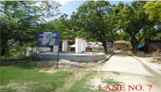
LANE NO. 7